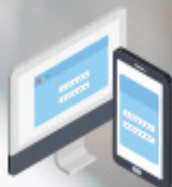
تطبيقات الموبايل و الانترنت