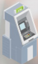
الصراف الآلي ATM