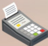
نقاط البيع POS